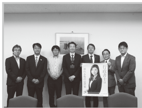
NHK名古屋放送局にて

平成29年10月10日(火)より全国でオリンピックナンバーの交付が始まるのを機に自動車登録手続が行政書士業務である事をPRするとともに、2020年東京オリンピックを応援する気持ちを込めて、交付初日に有志が集い一斉にナンバー交換する「みんなでオリンピックナンバーに交換する」企画を実施しました。