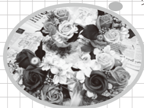
とても素敵な作品に 仕上がりました

小物にワイヤーを巻いたり、テープを巻いたり、細かい作業が続きましたが、どの作業も講師の方が各テーブルを回って丁寧に教えて下さり、皆さんスムーズに完成までたどり着くことが出来ました。製作時間は1時間半という短い時間でしたが、みなさんの個性が溢れたとても素敵な作品に仕上がりました。