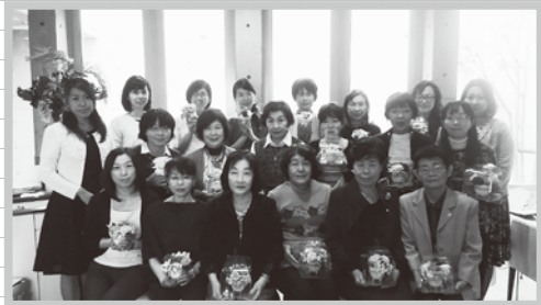
スープフラワーのアレンジメント

今回は、午前中からレストランをお借りして、製作とお食事の二部制で企画いたしました。前半は、講師をお招きし、スープフラワーのアレンジメント作りを体験しました。スープフラワーとは、名前の通り、石鹸素材で作られたお花ですが、本物と見間違えるほどのリアルさです。様々な色のスープフラワーがテーブルに用意され、そこから三つ好きな色のお花を選ぶとのこと、皆さん、一つ一つ手に取りながら、色の組み合わせを楽しまれ、作品作りがスタートされました。葉っぱやリボンなどの